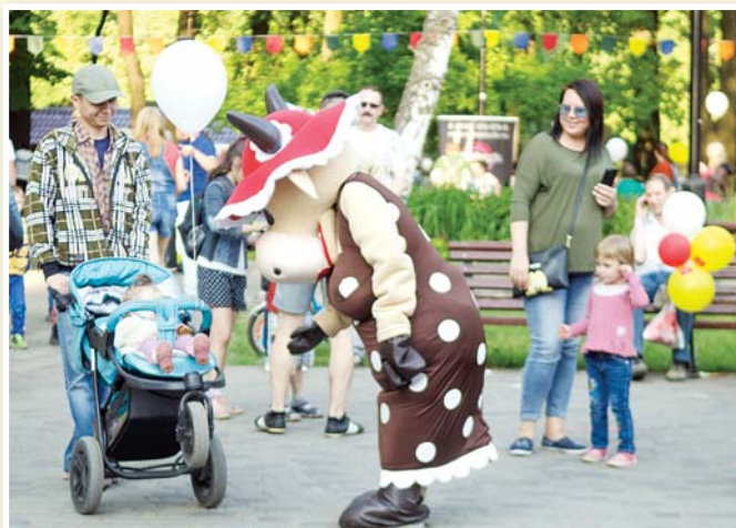
Корова Пестровка дарит посетителям парка улыбки и хорошее настроение.

ный центр «Грация» на ул. Физкультурной, 116, активно приглашал мальчишек и девчонок на занятия по спортивной и художественной гимнастике, танцам и карате, и кто знает, может быть, именно это приглашение услышал будущий олимпийский чемпион!