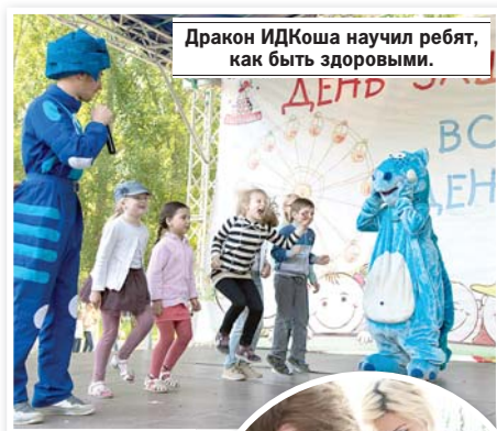
Дракон ИДК-коша научил ребят, как быть здоровыми.

Кстати, партнер праздника - учебно-спортив-