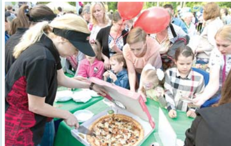
Самарцы охотно меняли пластилиновую пиццу на настоящую.

Кстати, в «Папа Джонс» всегда действует большое количество акций. Например, чтобы получить приятный бонус (пицца - в подарок), нужно всего лишь знать промокод. Найти его можно повсюду - от группы ВКонтакте до рекламных щитов на улице.