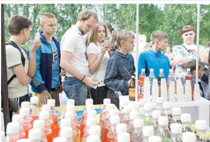
Необычные лимонады марки 3D вызвали восторг и у детей, и у взрослых.