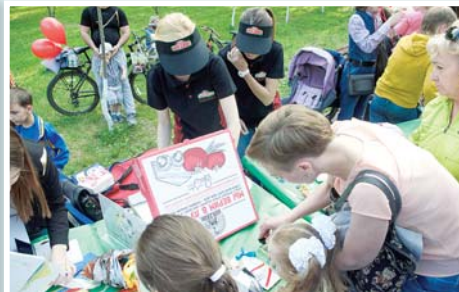
На площадке сети пиццерий «Папа Джонс» было многолюдно.