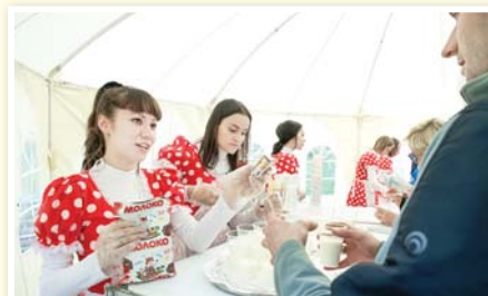
За три часа самарцы выпили больше тонны молока и кисломолочных продуктов!

Кстати, все, кто вырезал купон со страниц